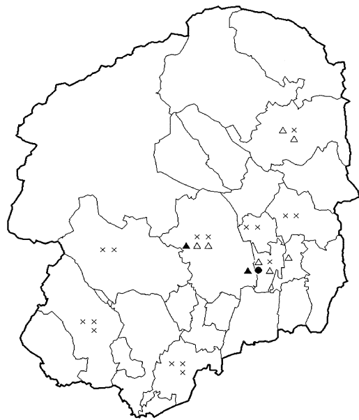
②なし黒星病発生葉率 (2013年6月)